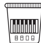
LEGGERE IL RISULTATO DEL TEST